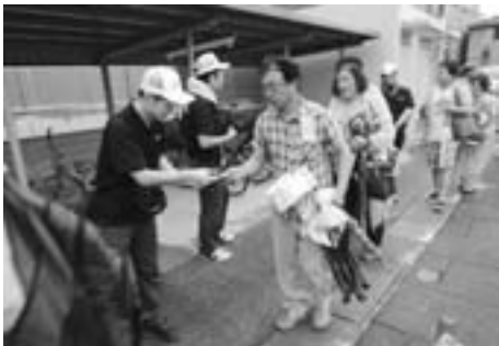
抽選券を一人一人に配布