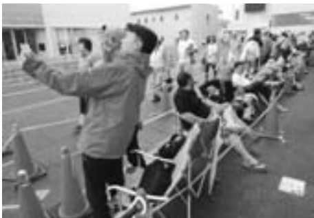
1番の抽選券をゲットし、記念写真を撮る若者