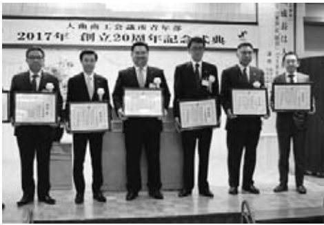
歴代会長 集合写真