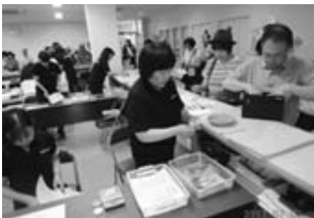
スムーズに進められたさじき席販売風景

この後申込み書を記入いただき、会議所内でA席、C席、イス席販売が大きなトラブルもなくスムーズに行われました。なお、6月30日には大曲商工会議所において第91回全国花火競技大会の記者懇談会が開催されました。この日佐々木会頭自らが広範囲に整備された打上場を幅広く利用しながら「生命のまつり」と題し