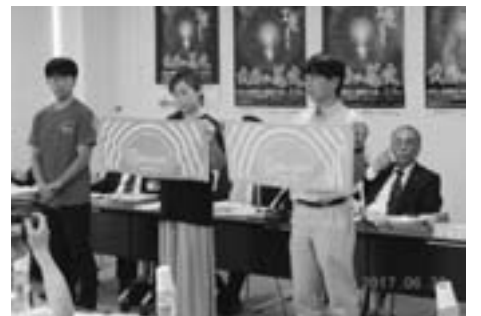
フェイスタオルやTシャツの公式グッズの紹介(6/30)

た大会提供の打ち上げ、有料自由観覧エリアに入場の際は、環境整備協力金として1000円が必要となるなどの変更点を説明しました。また、大曲商工会議所青年部から、Tシャツ、フェイスタオルなど公式グッズを大会当日に販売するほか、観光物産協会等でも絶賛販売中であることが報告されました。