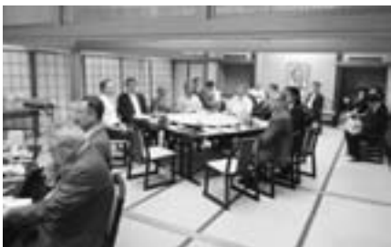
大曲・大川西根地区