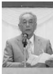
頭木会佐々木あいつ

青年部はもとより商工会議所も20周年を迎えます。全国的にみてもたいへん若い会議所です。そして若いゆえにパワーがあります。