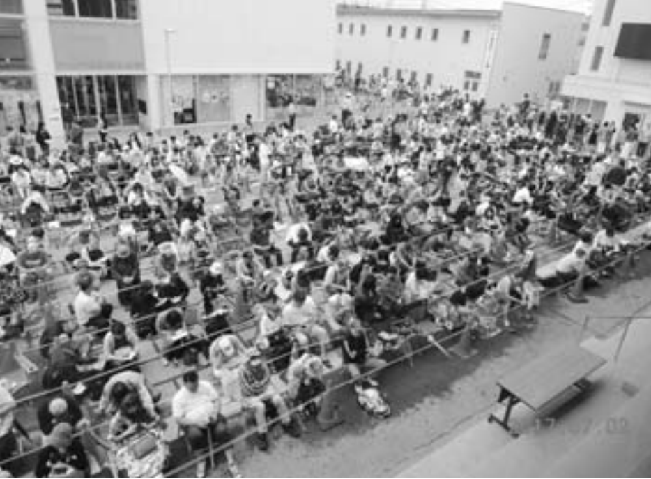
ヒカリオ広場には朝早くから大勢の方が詰めかけました(7/2)