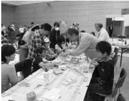
ものづくり体験の様子