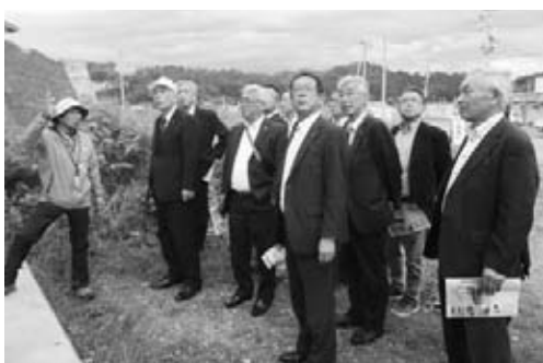
防潮堤前での防災ガイドの説明

が、6年が経過し防災に関 する意識が少しずつ薄らい できていることを感じるこ とも、震災の教訓を忘れ てはならないと改めて強く 感じました。田老地区では 防潮堤の工事が進められて おりましたが、震災前と現 在の田老地区では民家が高 台に移転したため街並みは 一変したそうです。 また2018年6月には 宮古と室蘭を結ぶフェリー の定期航路開設が予定され ており、工事が急ピッチで 進められていて経済効果が 期待されていきました。 今回の研修では、会議所 の事業の進め方や、震災復 興の状況等を実際に確認す ることができ大変有意義な ものになったと思います。