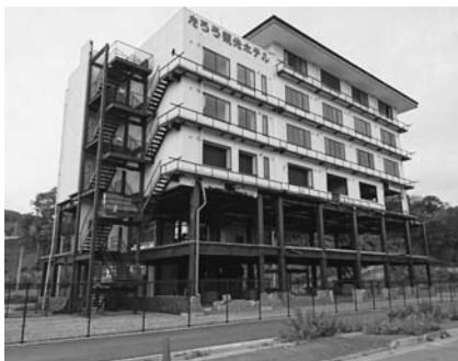
震災遺構「たろう観光ホテル」

その後、震災で津波の被 害に遭った商店街を徒歩に て視察しましたが、電柱や 建物の壁に「津波浸水深こ こまで」という看板が人の 背丈をはるかに超える位置 に数多く設置されていて、 津波被害の甚大さが身に染 みしました。また震災遺構と して残されている「たろう 観光ホテル」に行き、6階の 窓から社長が写したビデオ 映像について、語り部の方 から説明していただきました。 震災直後には、何度も同 じような映像を見て、自然 理解しているつもりでした