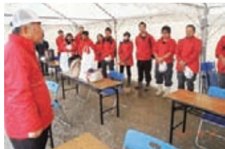
午前9時、会頭の訓辞で作業開始。パイプイス席を埋めたツアー客のみなさん。