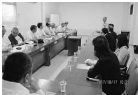
企業訪問 パドマソーデインドネシア