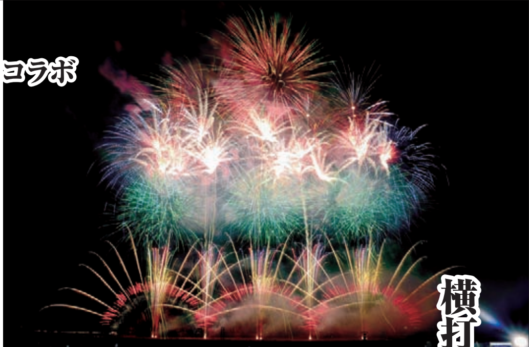
第4幕花火ミュージカル2017「ライオンキング」のスターメイン