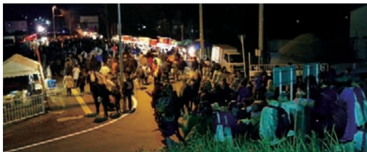
大仙警察署の「一時停止」退場誘導により整然と帰る観覧者