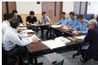
5月24日、大仙警察署で「規制、会議。効果を最大限に」音響スタッフ。