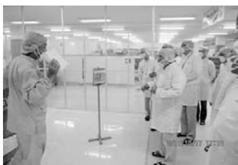
企業訪問 ホギメディカルインドネシア