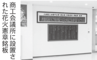
商工会議所に設置された花火憲章銘板