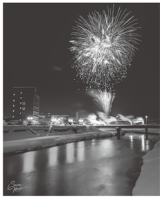
記念花火の打ち上げ