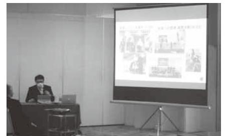
青年部活動報告の様子