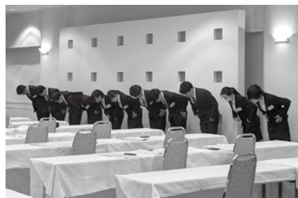
お辞儀の仕方の練習