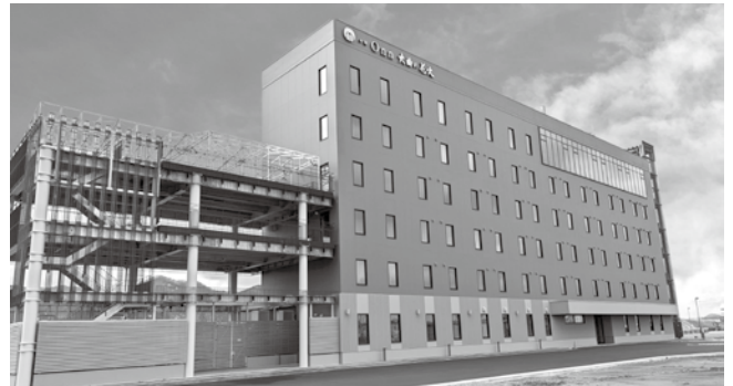
4月24日(木)にプレオープンする「お宿Onn大曲の花火」 ※内覧会のご案内については同封チラシをご覧ください。