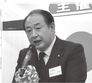
御法川衆議院議員 祝辞