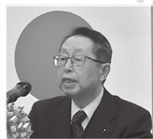
渡部県議会議員 祝辞