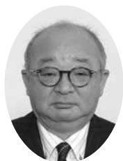
サービス業部会長

業を企画できればと願っております。そのためにも、皆様からのご提案やご協力を賜れますと幸いです。本年もどうぞよろしくお願い申し上げます。