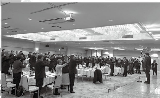
新年の門出を皆さまとともに