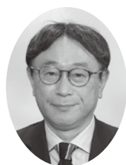
食品関連業部会長